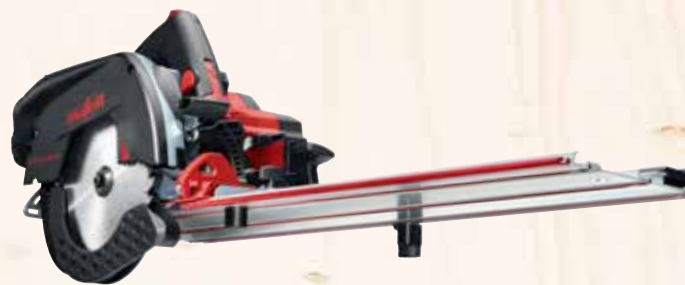
Kappschiene-Säge KSS 60 18M bl